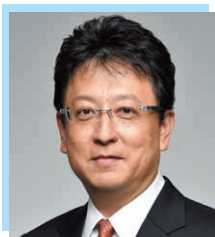
熊本港ポートセールス 協議会会長(熊本市長) 大西 一史