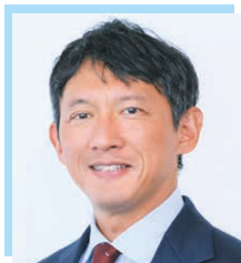
八代港ポートセールス 協議会会長(八代市長) 小野 泰輔