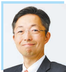
熊本県知事 木村 敬